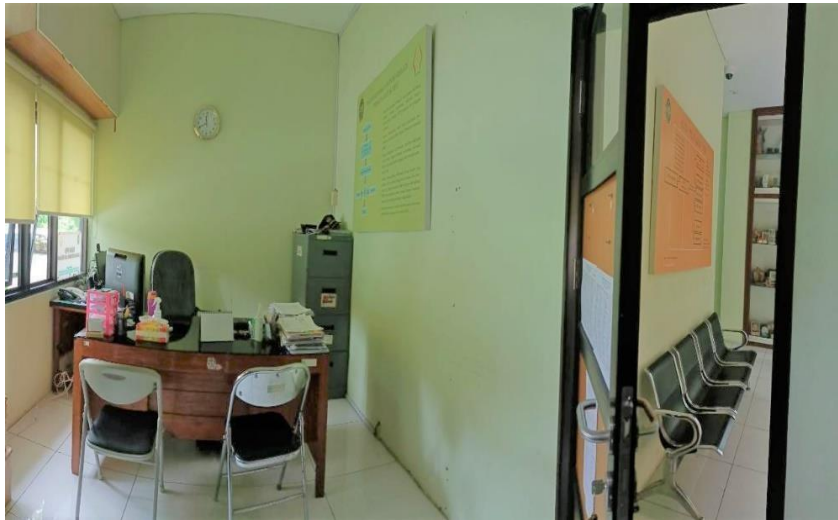
Gambar 3. Fasilitas Pelayanan Informasi Publik.

Ruang Pelayanan Informasi ini berada di Mal Pelayanan Publik Kompleks Balaikota Yogyakarta serta Kantor Dinas Komunikasi Informatika dan Persandian Kota Yogyakarta. Ruangan ini dilengkapi dengan satu unit komputer, satu pesawat telepon, dan tempat duduk untuk petugas dan penerima layanan. Publik juga dapat melakukan permohonan informasi secara online dan penyampaian keberatan melalui ppid.jogjakota.go.id dan e-mail ppid@jogjakota.go.id . Layanan online melalui website ini telah tersedia sejak tahun 2019.