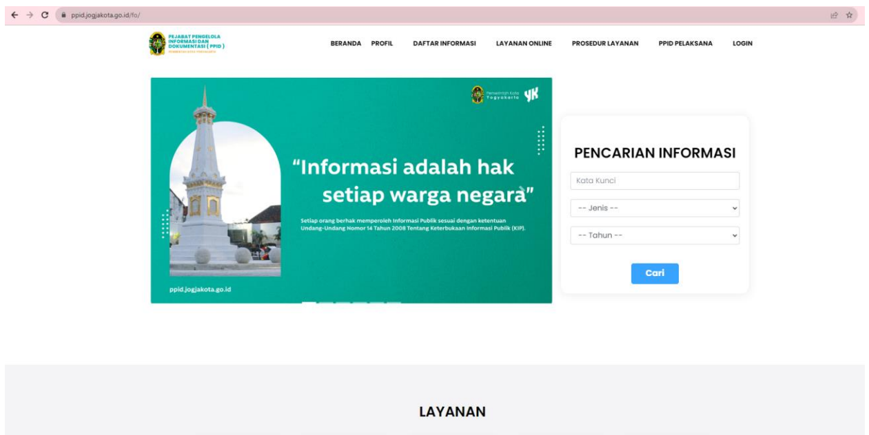
Gambar 2. Tangkapan Layar Sub Domain ppid.jogjakota.go.id

Informasi publik terkait pelaksanaan program kota dan kegiatan Walikota/Wakil Walikota juga dapat diakses melalui aplikasi android Jogja Smart Service dan media sosial Kota Yogyakarta yang dikelola oleh Dinas Komunikasi Informatika dan Persandian Kota Yogyakarta. Saat ini terdapat 5 (lima) platforms media sosial yang digunakan oleh Pemerintah Kota Yogyakarta yaitu Twitter (PemkotJogja), Instagram